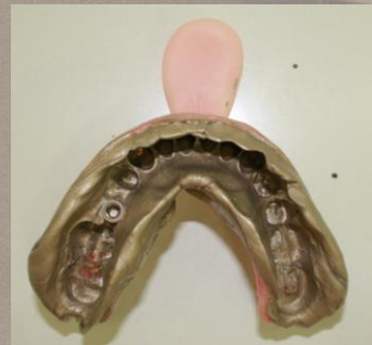
4. 固まったら完成です