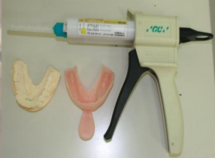
1. 型をとる材料です