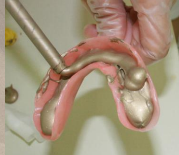
2. 専用トレイに材料を流します